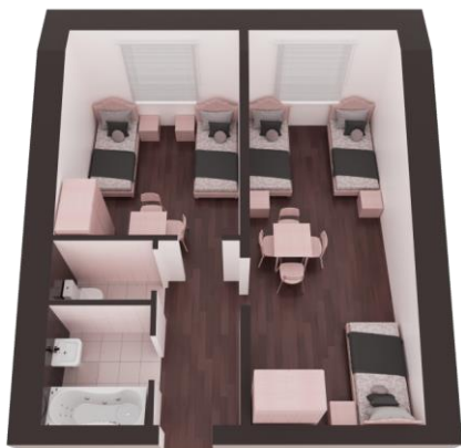
Блок женского общежития