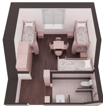
Блок мужского общежития