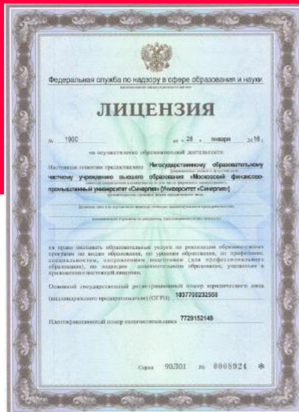
Государственная лицензия № 1900 (бессрочная)