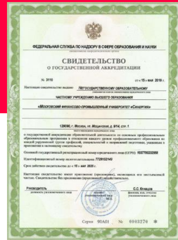
Государственная аккредитация № 3110 (от 15.05.2019 года)